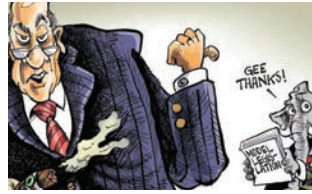
El dibujante Phil Hands | pag. 5