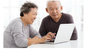
Vida asistida y personas mayores Contratos de inicio | pag. 5