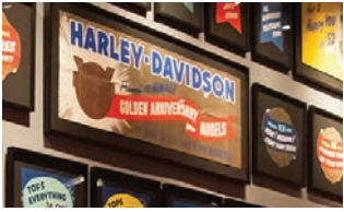
Excursión de un día a Milwaukee | pag. 2