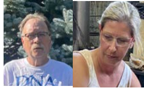
新董事會成員 簡介 | 第 3-4 頁