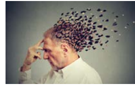
神經系統疾病 隨著我們年齡的增長 | p. 5