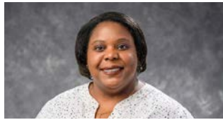
Contested Black Freedom nyob Wisconsin | p. 5