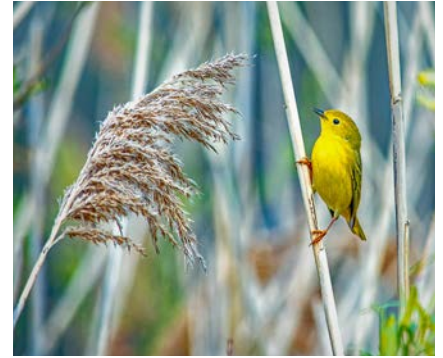
High Cliff State Park, Tsib Hlis 2023.

"kev txuas" thiab "detachment" smooths kev hloov. Kev ua haujlwm pab dawb hauv zej zog yog ib qho tseem ceeb tshaj plaws uas kuv tau pom thaum so haujlwm. Koom nrog UWRA yog lwm qhov. Txawm hais tias kuv tuaj yeem mus xyuas cov phooj ywg thiab tsev neeg hauv lwm qhov chaw hauv lub tebchaws, Wisconsin yuav nyob hauv tsev.-