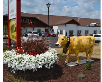
Duab los ntawm ntawm ntawm koj lub computer thiab tawm mus sab nraud. Ib txhia txoj cai ve.

G reen County yog lub plawv ntawm Wisconsin's (thiab America's) mis nyuj thiab cheese kev lag luam thiab tsev rau brewers thiab vintners thiab. Qhov no delectable tasting ncig saib yuav mus los ntawm tshab npav los ntawm count-