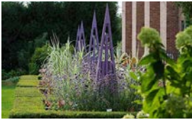
Tsheb npav mus rau Janesville Gardens, Tsev khaws puav pheej | p. 4