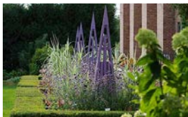
Viaje en autobús a los jardines y museo de Janesville | pag. 4