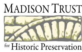
Actividades en Jubilación: Arquitectura | pag. 7