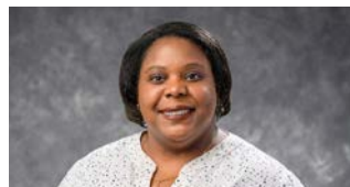
Libertad negra impugnada en Wisconsin | pag. 5