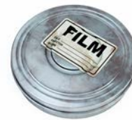
數位化記憶 | p. 9