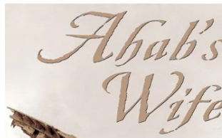
書籤 | p. 8