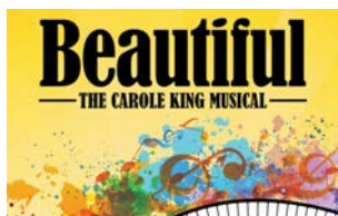
劇院遊覽 | p. 4